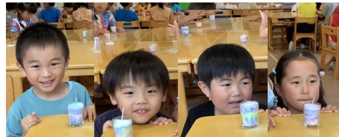
キャンドル作り サマーキャンプ