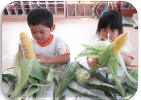
とうもろこしの皮むき