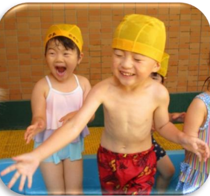
水あそび たのしい!