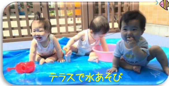
テラスで水あそび