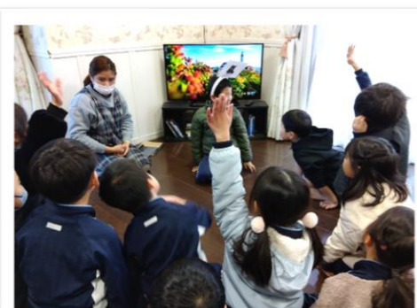
英語を楽しく学んでいます！