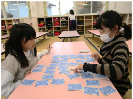
ボードゲームやカードゲーム でいざ勝負!!