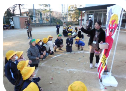
鬼は外〜! 豆まき会を開催してみんなで鬼を追い払いました!