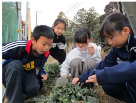
ブロッコリーの芯が硬い事に びっくりしたね!