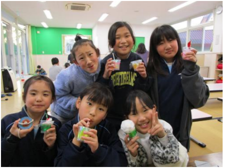
プリンのカップを使って かわいいジュースを作ったよ!