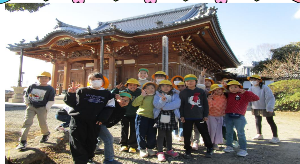
お寺へ散歩に行きました！

木々や花が芽吹き始める様子を、春の訪れを感じる季節となりました。今年度も残りわずかとなりますが、この1年を振り返り一人ひとり自分のペースでたくましく成長した姿にうれしさを感じています。そして、間もなく新年度の保育が始まります。学年が1つ上がり子ども達にとっては期待と不安が交差する時期となります。学童では、子ども達の心のケアにも努めながら、充実した時間が送れるよう進めていきたいと思ひます。春休み中には、毎年恒例の「雷電フェス」が開催されます。お寺のお祭りと合わせて、子ども達が元気いっぱい活動できる行事を計画しています。保護者の皆様には、1年間ご協力をいただき誠にありがとうございました。