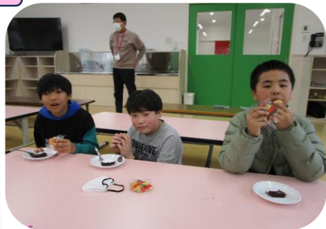
おやつと一緒に、はいっチーズ♪