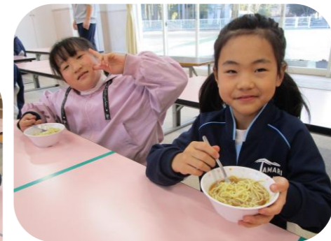
美味しいの笑顔がたくさん♪