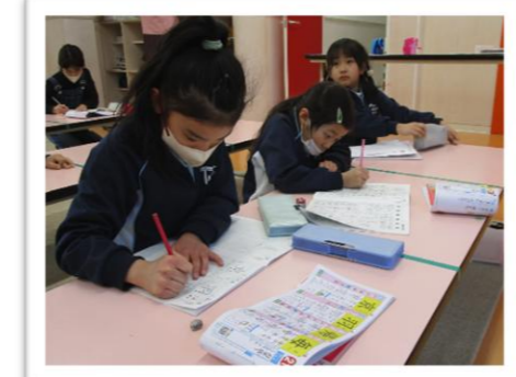
一生懸命、勉強に取り組んでいます!