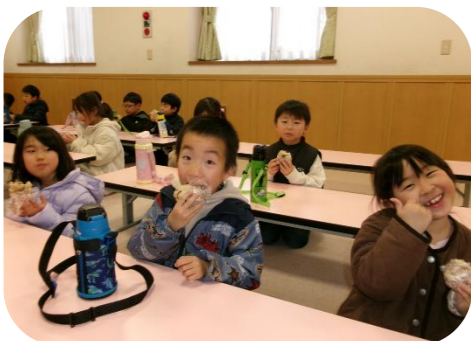
みんなで食べると美味しさ100倍♪