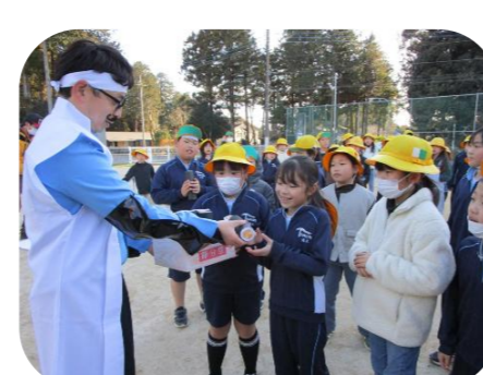
最後は桃二郎さんから恵方巻を贈呈♪