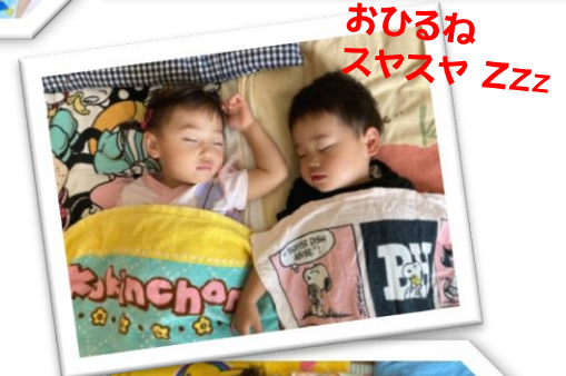
おひるねスヤスヤ Zzz